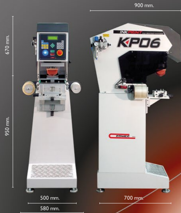
INKPRINT KP06 1C z hermetycznym kałamarzem i ceramicznym pierścieniem Ø 110 mm