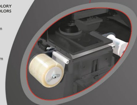
INKPRINT KP06 2C RR z hermetycznym kałamarzem, pierścieniem ceramicznym Ø 110 mm i stalową podstawą