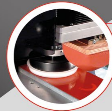
ZAMKNIĘTY KAŁAMARZ CLOSED INKCUPI

INKPRINT KP06 pracuje z kałamarzem hermetycznym i pierścieniem ceramicznym Ø 110 mm