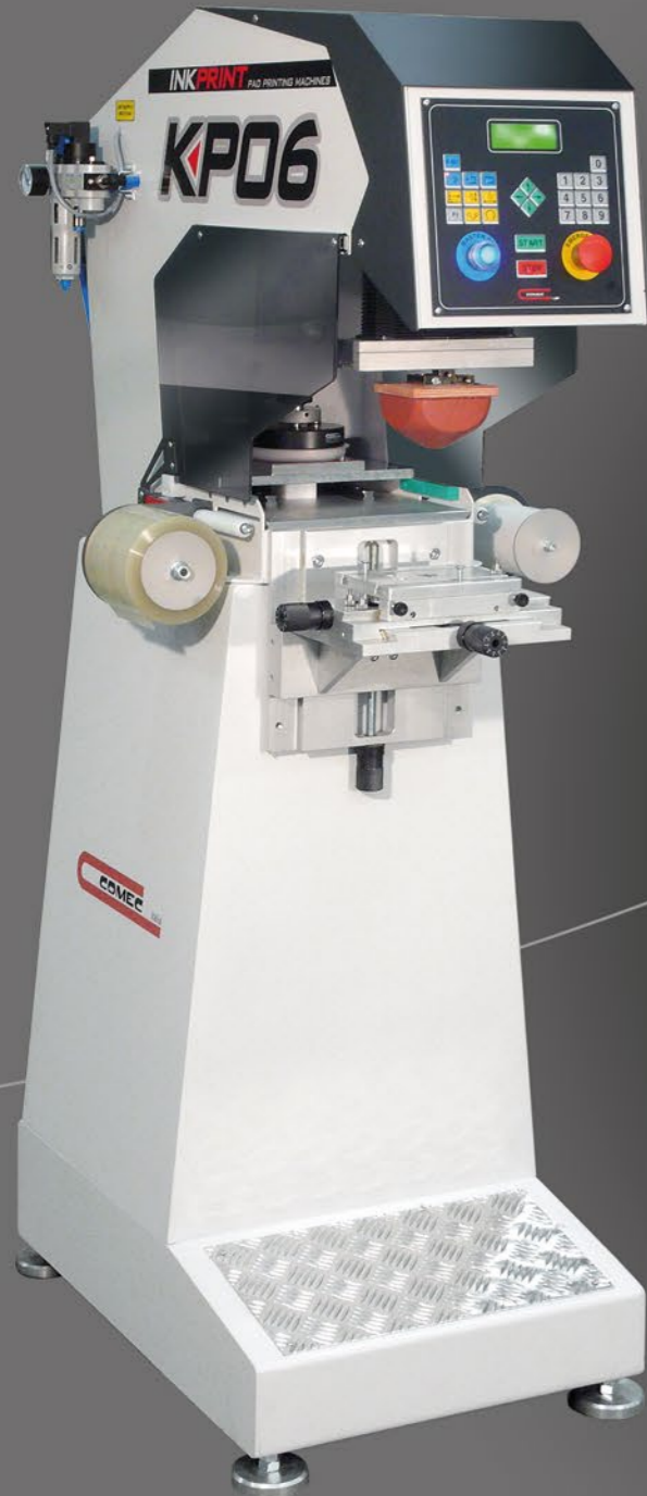
OPCJONALNE PODAJNIKI OPTIONAL CONVEYORS